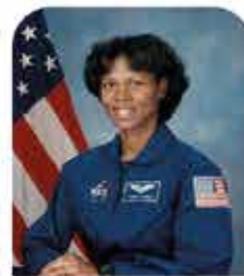
Yvonne Cagle | Astronauta Nasa