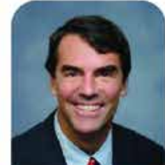
Tim Draper | DFJ y Draper University